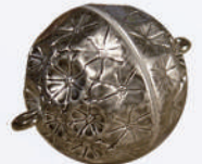
Z 131018 ø 18 mm