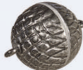
Z 131015 ø 16 mm