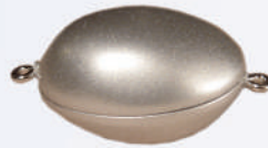
Z 120828 ø 25/18 mm