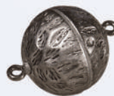
Z 131016 ø 16 mm