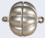
Z 071015 ø 17 mm