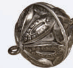
Z 131017 ø 18 mm