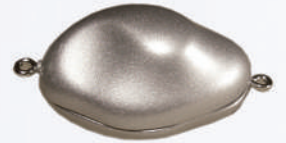
Z 120827 ø 30/20 mm